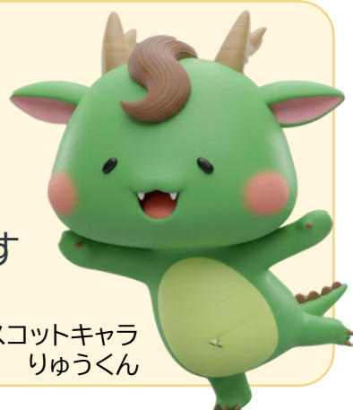
マスコットキャラ りゅうくん